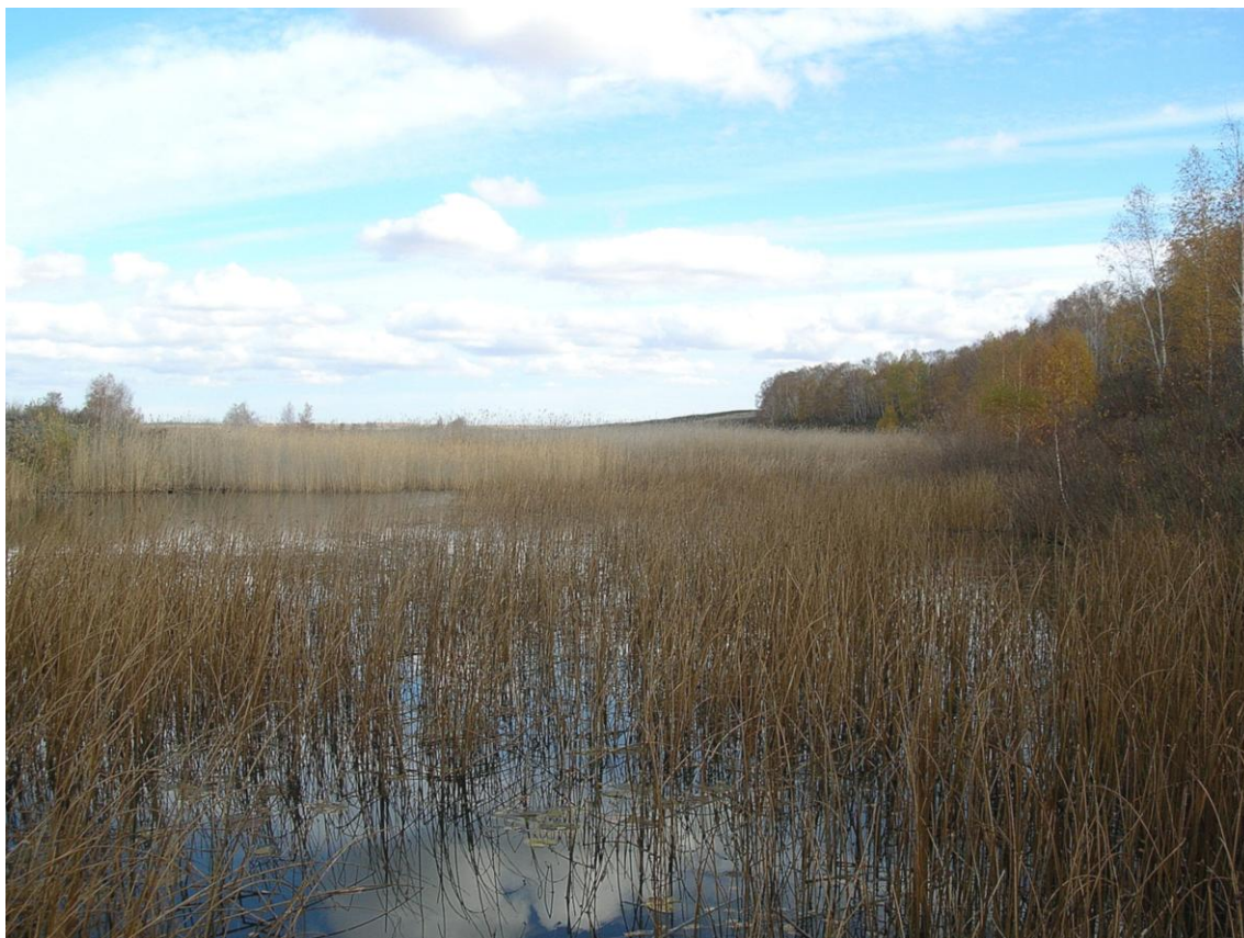
Просторы Зауралья – выровненная и заболоченная Сибирская платформа (Брединский район Челябинской области)

началу освоения железной руды в уральском регионе и приходу «железного века».