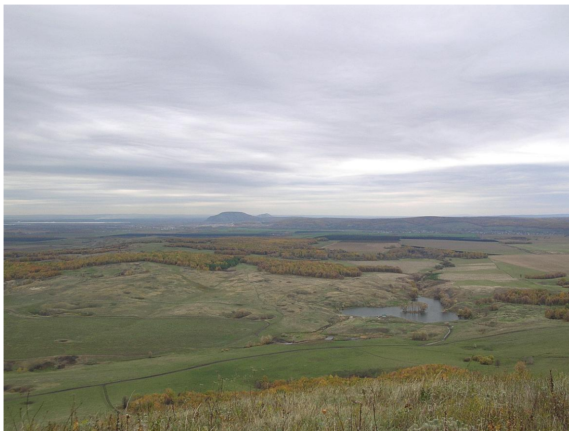
В северных землях, согласно Гесиоду, пролегают «концы и начала» мира (вид с вершины Тратау; Ишимбайский район РБ).

Что касается северной части света, расположенной на «Стороне ночи» рядом с подземным Тартаром у обтекающего землю Океана, то здесь мы находим те же сентенции ( извл. 2 ), что и у Гомера: мрак, туман и мглу. Именно здесь, согласно Гесиоду, пролегают «и концы, и начала» мира. Однако сведения об отдаленных землях несколько расширяются, что видно из некоторых других сочинений, дошедших до нас под авторством Гесиода (правда, в отрывках или по ссылкам из других источников). В «Астрономии» говорится о расположенном на северном краю небосвода созвездии Большой Медведицы ( извл. 7 ). По сообщениям Страбона и Стефана Византийского, Гесиод повествует о странном народе «полупсов» ( извл. 10 ): может быть, он ведет речь о каком-то северном варварском племени, исповедующем культ охотничьей или ездовой собаки.