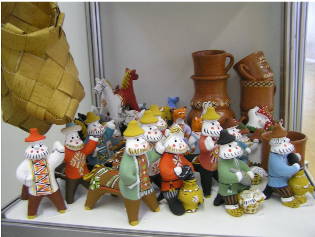
Изделия каргопольских мастеров (2006)