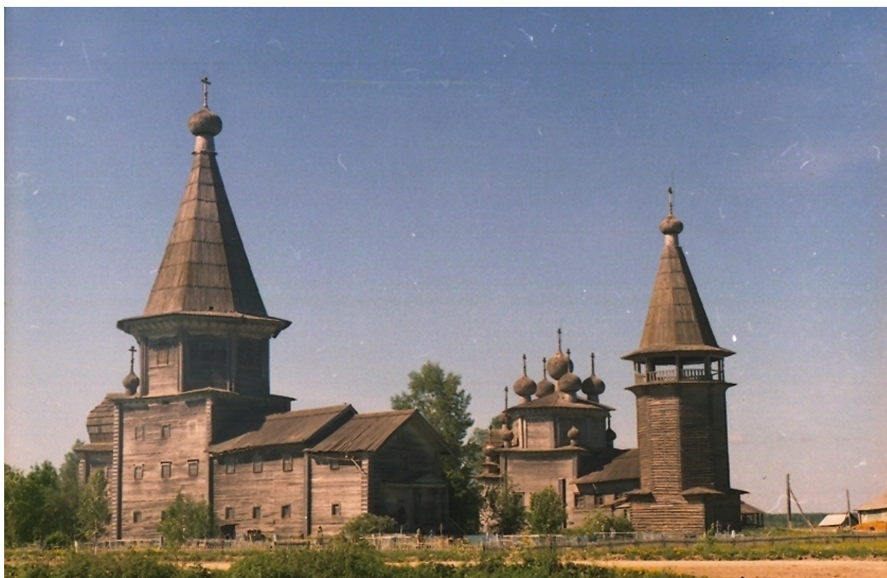
Таким храмовый ансамбль (тройник) выглядел в 1998 году