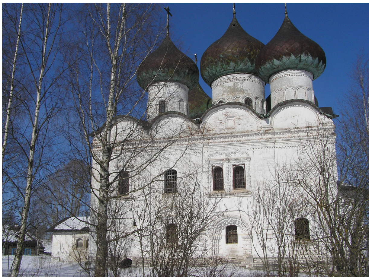
Троицкий храм, ныне музейный объект (2002)