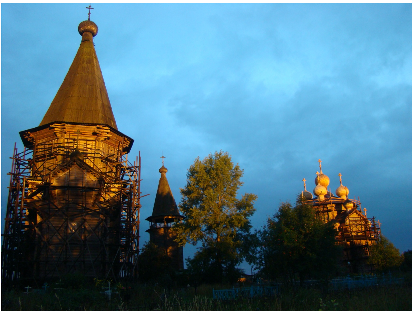
Так выглядел Лядинский храмовый ансамбль в ходе реставрации в 2012 году. Ныне шатровые храмы сгорели во время пожара.

И комплекс храмовый в Лядинах, Что русский гений создавал, Как принято у нас в старинах, Я б Свято-Троицей назвал.