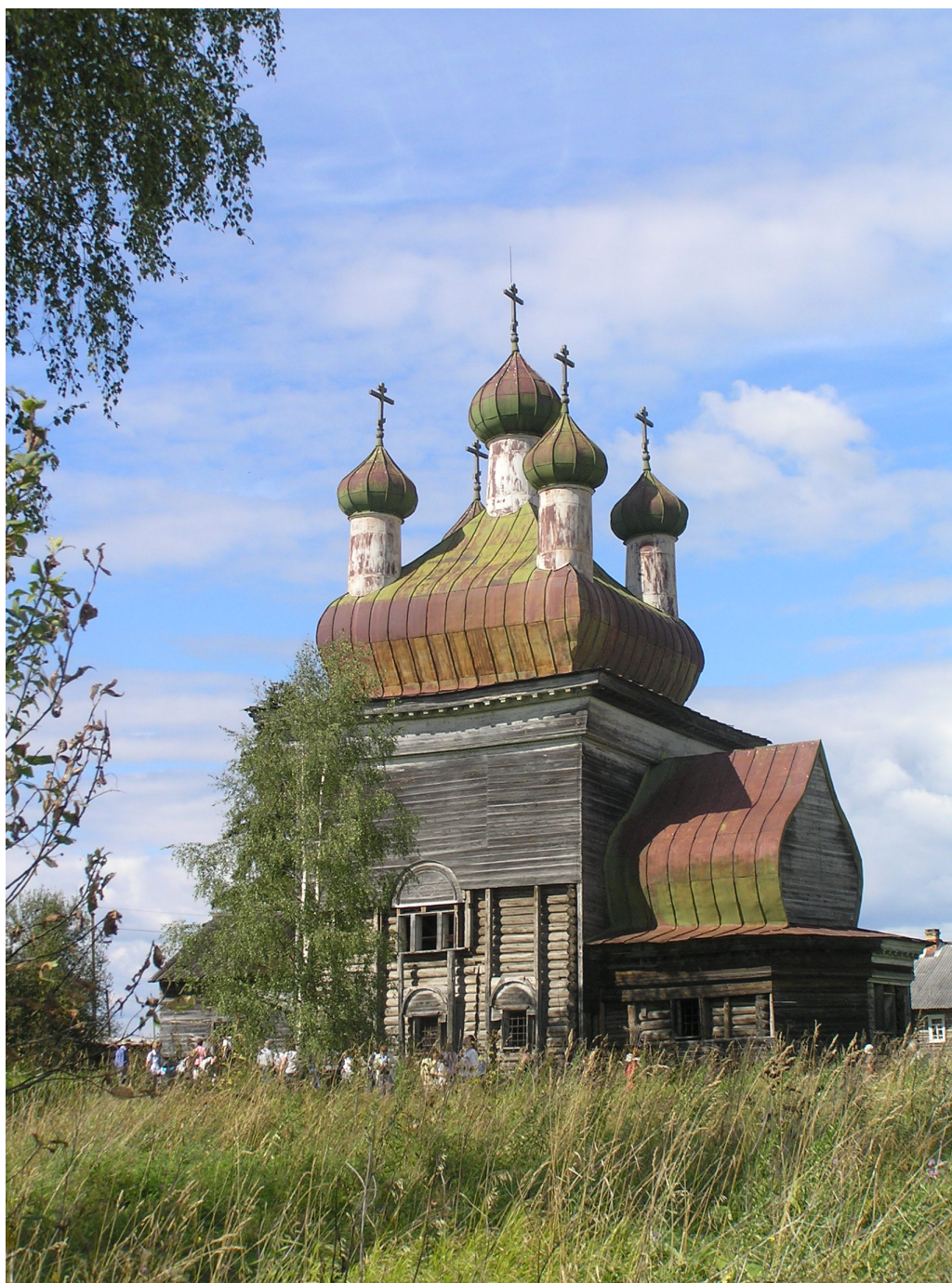
Сретенская церковь в селе Архангело (2016)

Там, где Архангельский тракт пересекает Онегу и устремляется далее на Архангельск, стоит село Архангело (тоже куст деревень). От Каргополя 56 километров. На окраине села Сретенская церковь и храмовый ансамбль погоста. Одна из двух церквей, Сретенская , построена в 1715 г. Такой оригинальный тип храма встречается только на Русском Севере. Массивный кубоватый четверик завершается пятиглавием. Центральная главка возвышается на массивном луковидном куполе, по краям которого красуются ещё четыре главки. Пятигранная апсида с бочковидным завершением. Мастер-зодчий сумел достичь здесь такого сочетания форм, что массивный куб и столь же массивный центральный купол кажутся изящными при пяти устремленный вверх маковках. Внутри храма росписи «неба».