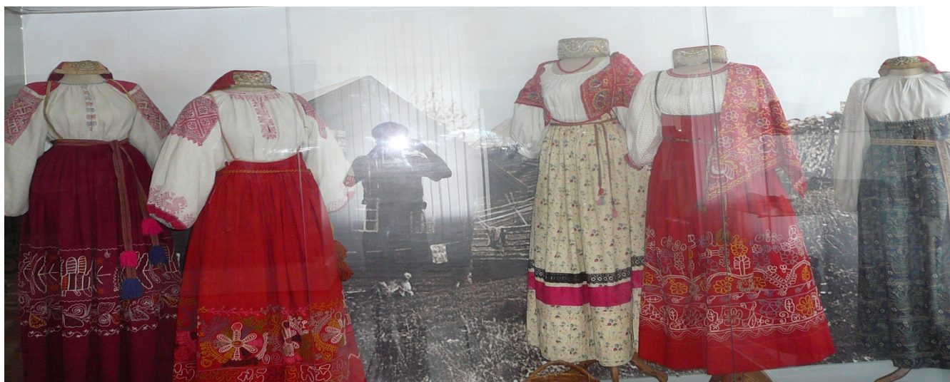
Каргопольский традиционный женский народный костюм в экспозиции Каргопольского музея (2018)