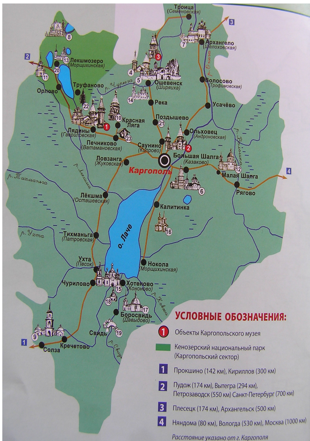
Архитектурные и природные памятники Каргополя. Фото из буклета Каргопольского музея

Решетников Н.И. Русский Север. Путевые очерки. Каргопольские зарисовки. М., 2023. – 86 с. Фото автора, а также из открытых источников интернета.