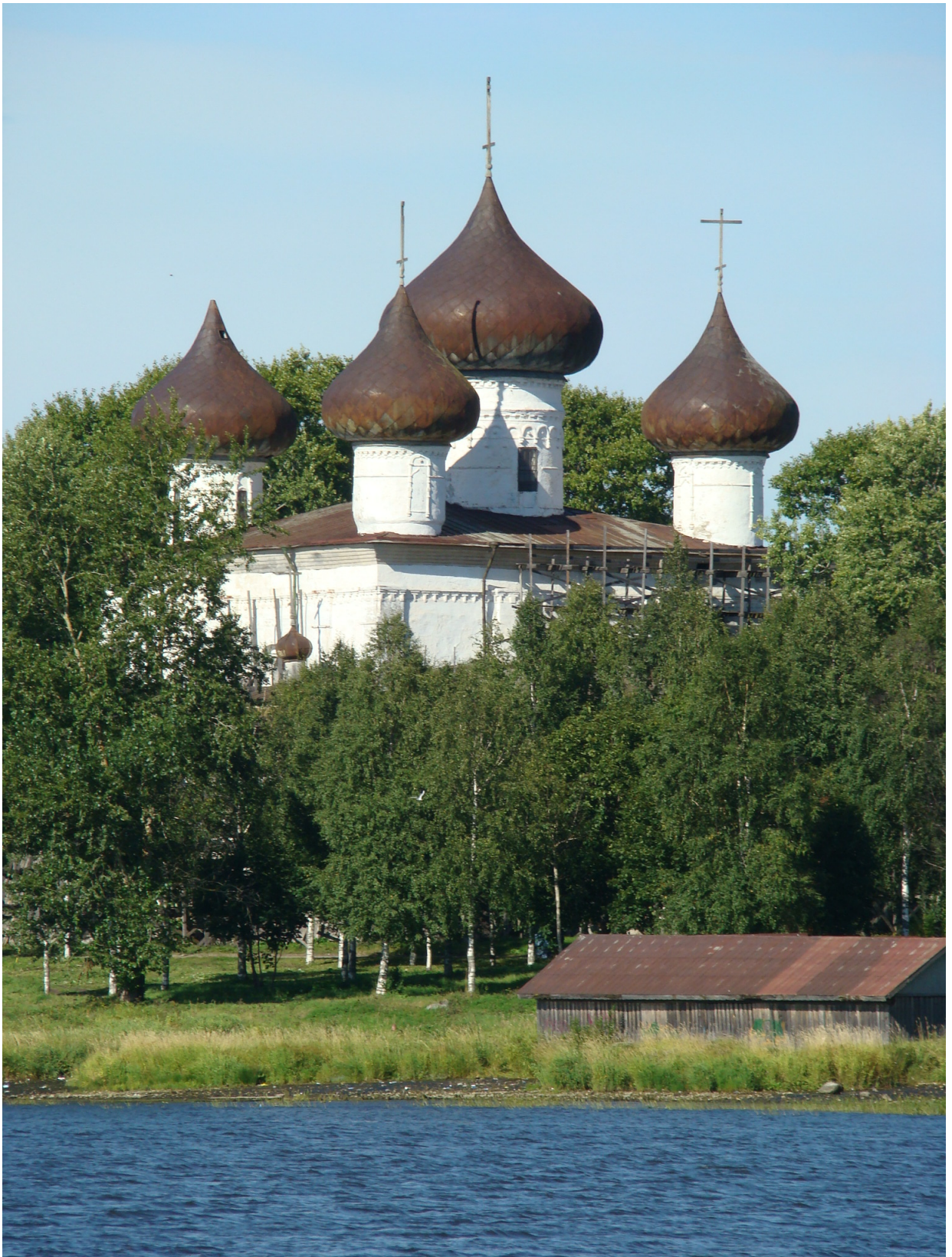
Собор во имя Рождества Христова в Каргополе (2016)