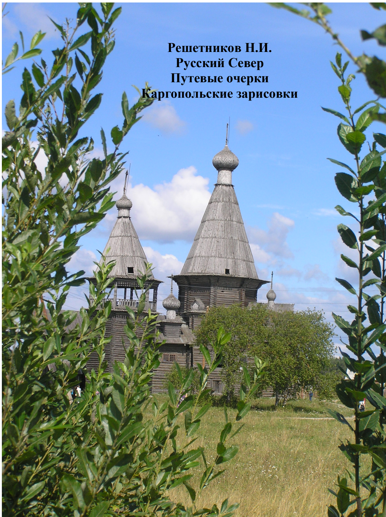
Храмовый ансамбль церкви Иоанна Златоуста и колокольни в селе Саунино Каргопольского района (2014)