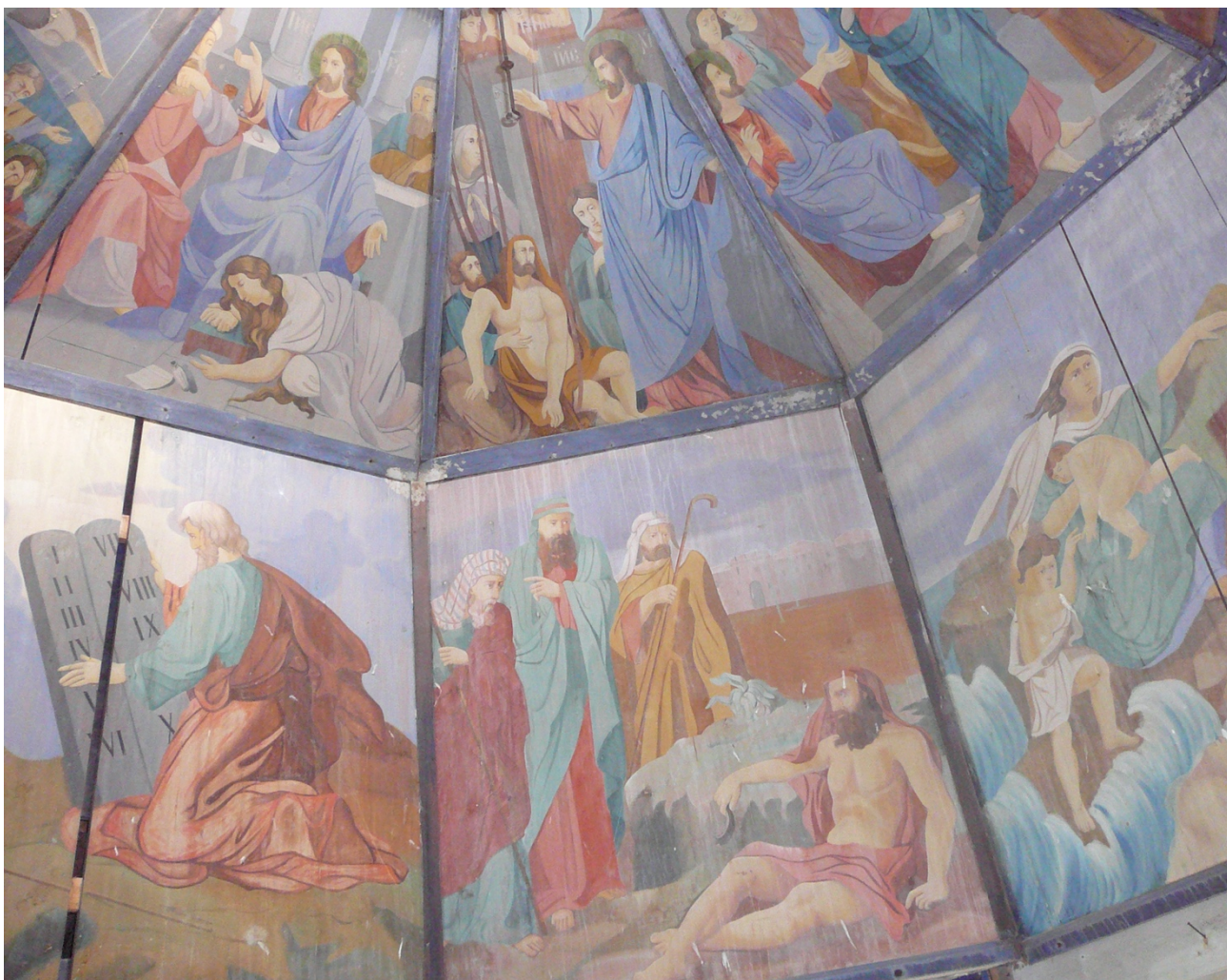
Роспись неба в часовне в Калитинке (2014)

Можно также совершить путешествие вокруг озера Лаче. На этом пути встретятся селения Лекшма, Тихманьга, Ухта, Кречетово, Хотеново, Нокола, Слободка, Калитинка. От Кречетово есть дорога на Вытегру, Белозерск, Вологду, Санкт-Петербург. Если начать путешествие вдоль западного побережья озера Лаче на юг, то на пути встретятся впадающие в озеро реки Лекшма (вытекающая из Лекшмозера и пересекающая Петербургский тракт западнее Лядин), Тихманьга, Ухта, живописная Свидь, Ковжа и Кинема.