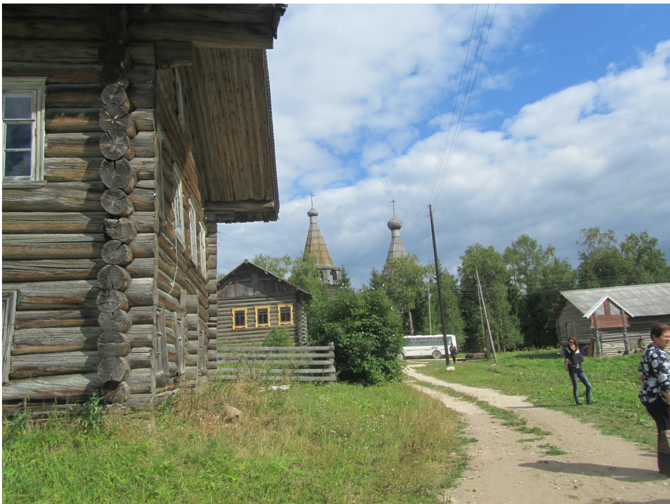
Улица вдоль реки Чурьегга с видом на храм Иоанна Богослова и колокольню в деревне Погост поселения Ошевенское (2018).

обители. Характерно, что не только монастырь, но и все другие памятные места (родники, камни, рощи, тропы) посещаемы. Здесь стоят памятные кресты, связывающие наше далекое прошлое с днем сегодняшним.