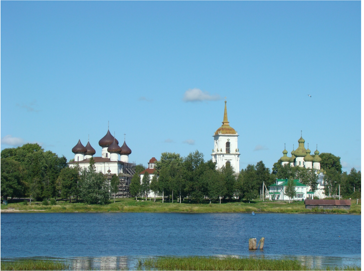
Соборная площадь в Каргополе на левом берегу Онеги (2016)