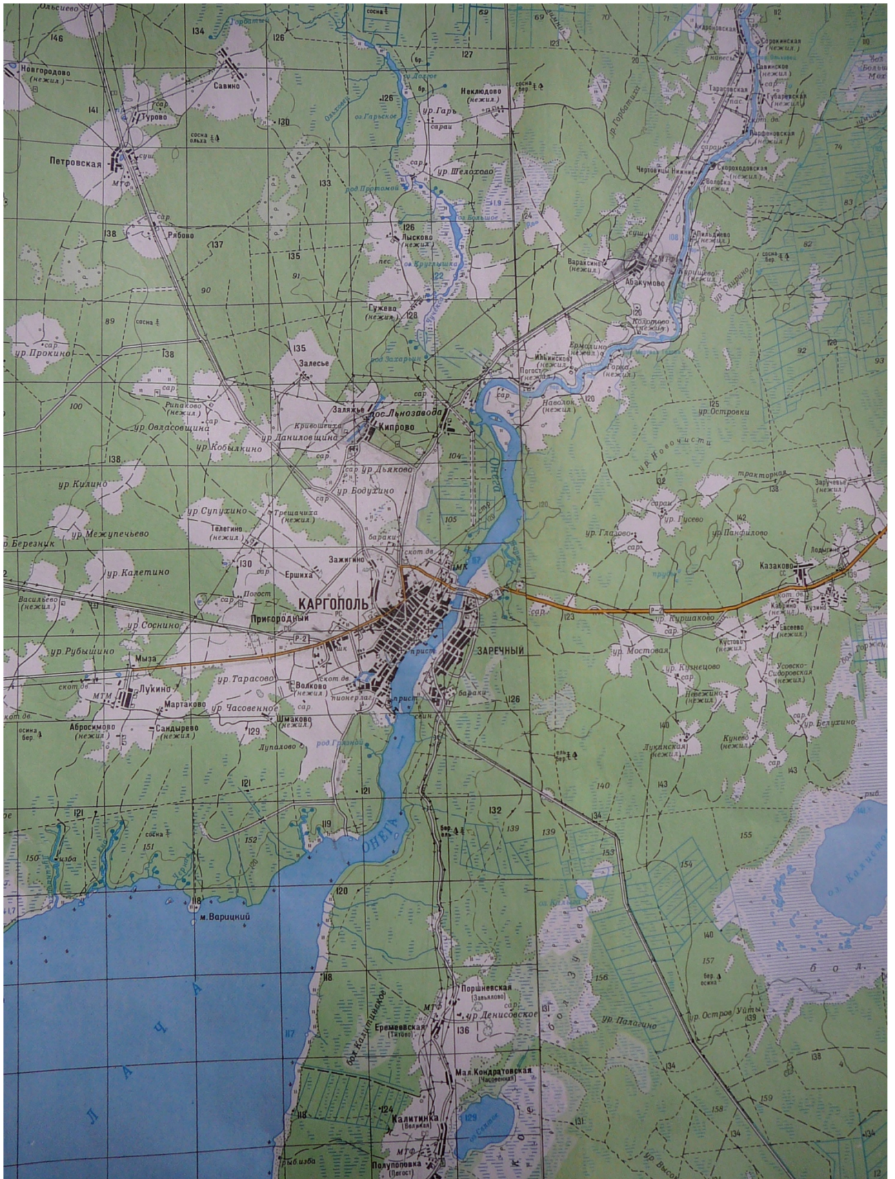
Карта Каргополя и его окрестностей (фото с экспозиции Каргопольского музея)