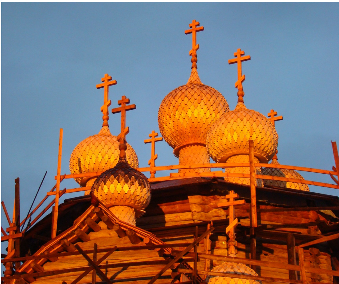
Богоявленская церковь в ходе реставрации (2012). Шатровых храмов уже нет.