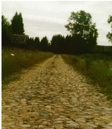
Булыжная мостовая, оставшаяся с дореволюционных времён на Шенкурском тракте (2002)

(1783). Храм сразу не увидишь. Зарос он вокруг могучими деревьями. И только сквозь их кроны просвечивает купол церкви. Давно она закрыта. Прихода нет. Проживает здесь людей совсем мало и, в основном, только летом. Редко какой богомольный прохожий заглянет сюда, пол подметет, табуретку оставит, а то и стихи в тетрадке напишет. Вот и вся забота. А некогда богатое село было. Школа напротив церкви работала. От неё лишь развалины остались.