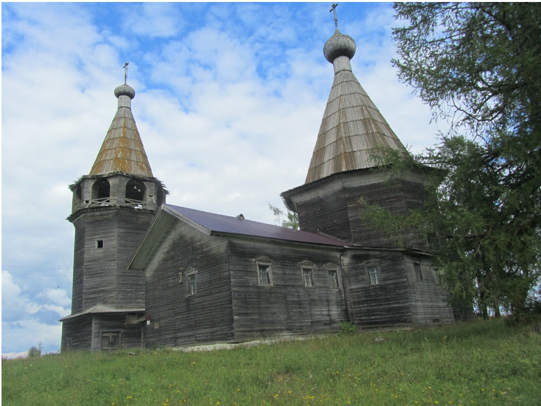
Ансамбль церкви Иоанна Богослова и колокольни (2018)