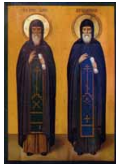
Преподобный Антоний Великий и Пахомий Кенский (икона хранится в Кенозерском национальном парке)

Скончался Пахомий в 1525 г. (память в субботу по Богоявлению). Имена преемников Пахомия установлены не все. Известны лишь Вассиан, Иосиф, Исаак, Каллиник. Известно также, что здесь принял монашество известный русский святой Антоний Сийский. В XVII в. Спасо-Преображенский мужской монастырь обладал крупными земельными наделами и пользовался большим влиянием в округе. В царской грамоте Кенскому монастырю за 1691 г. читаем: «В Каргопольском уезде на реке Кене монастырь Спасский, Пахомиева пустынь, а в нём две церкви да келья игуменская пустая, да шесть келий, в них служебных и больничных старцев семнадцать человек, да келья поваренная, да три кельи пустых, да за монастырём двор монастырский, а в нём живут монастырские детёныши. За рекою Кеною двор скотный, да... двор монастырский» 65 . Кроме земельных и лесных угодий монастырь владел санными покосами не только в Кенорецкой волости, но и под Каргополем, за рекой Онегой против церкви Зосимы и Савватия, у озера Лаче.