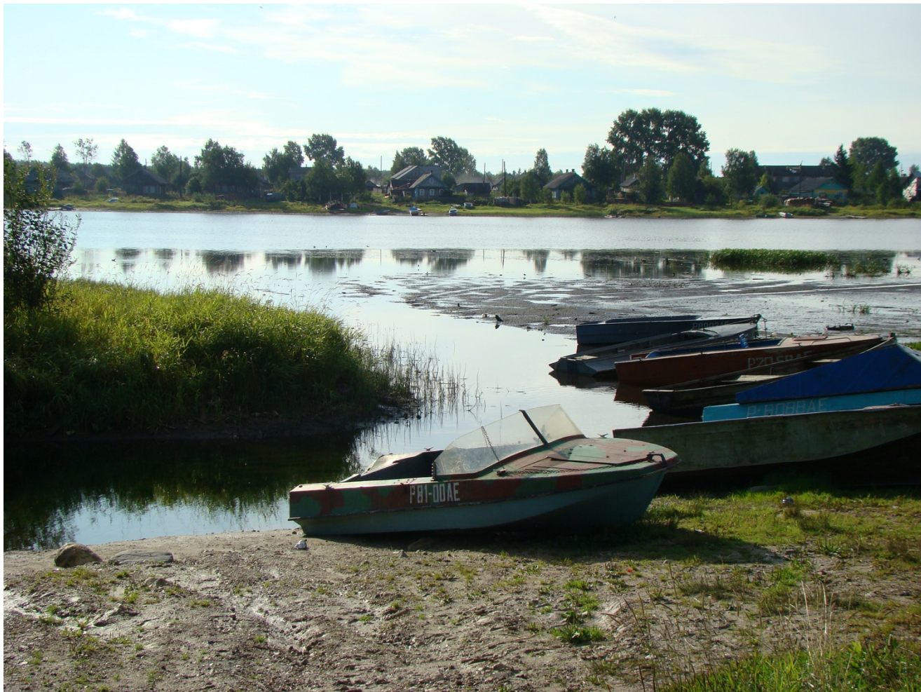
Лодки-каргополки на левом берегу Онеги (2008)

проходимая. В старину купцы по ней с товарами ходили. Ныне маршрут на лодках-каргополках проложен Каргопольским музеем вместе с турбазой «Лаче».