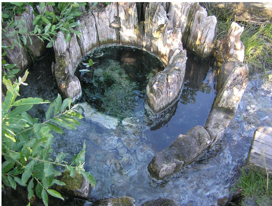
Сероводородный источник на левом берегу Свида близ Хотеново (2016)

Если выехать по этой дороге из Каргополя и, миновав мост через Онегу повернуть направо, то можно проехать вдоль восточного берега озера Лаче и побывать в Калитинке, Слободе и Ноколе. Здесь мы пересечём впадающие в озеро Лаче речки Кинему и Ковжу. За Ноколей, с южной стороны в озеро впадает живописная река Свидь, у устья которой на его левом берегу располагается Хотеново (Кононово). В местной школе создан краеведческий музей. Неподалеку рукотворный памятник природы - сероводородный источник, к которому любопытных приведёт незаметная тропа. Источник этот облагорожен и использовался ранее, как уверяют местные жители, для лечения кожных заболеваний и желудочно-кишечного тракта. Местные жители называют его «Вонявой», поскольку он источает неприятный запах.