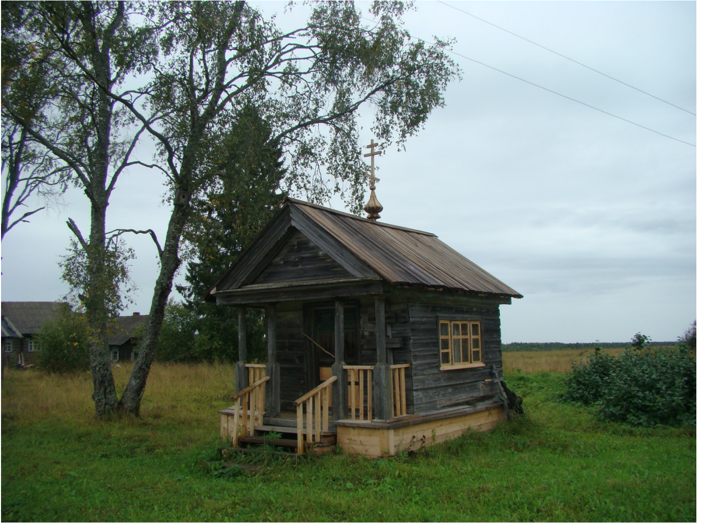
Спасская часовня в деревне Фоминская Лядинского погоста (2016)