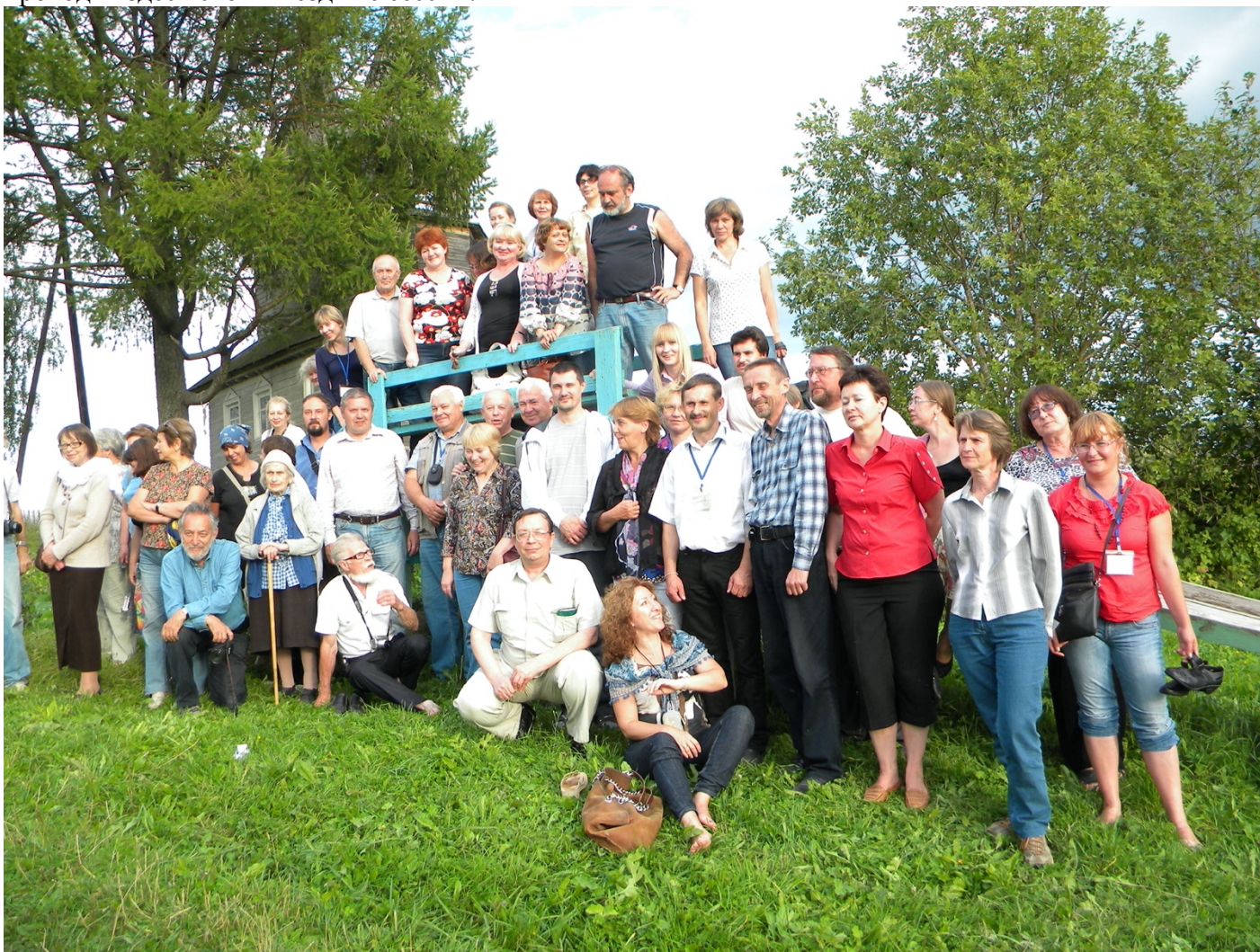
Участники очередной Каргопольской научной конференции у часовни св. Георгия в деревне Низ (2014)

Не спешите покидать Ошевенск, побывав в монастыре. Здесь ещё много удивительного и примечательного. Пройдите по сельскому поселению, который некогда состоял из куста деревень. Здесь местные жители создали музей деревянного зодчества под открытым небом «Ошевенская волость». Звонят над речкой Чурьегой голоса фольклорного ансамбля, который гостеприимно встречает гостей, разыгрывая перед ними театрализованные представления с традиционным угощением. А Каргопольский историко-архитектурный и художественный музей проводит здесь свои выездные сессии.