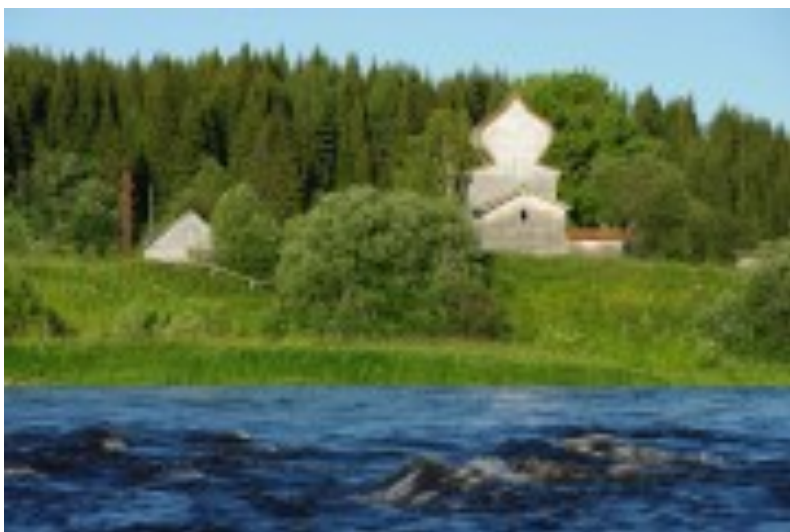
Фото Дмитрия Островского (2009)

Над Бирючевскими порогами у Емецкого волока, в среднем течении реки Онеги, там, где начинался волок на реку Емцу, приток Северной Двины, в маленькой деревушке Пустынька в 1719 г. была возведена Благовещенская церковь, отличающаяся двумя бочкообразными покрытиями. Храм двухэтажный, выглядит монументально. На первом этаже храма