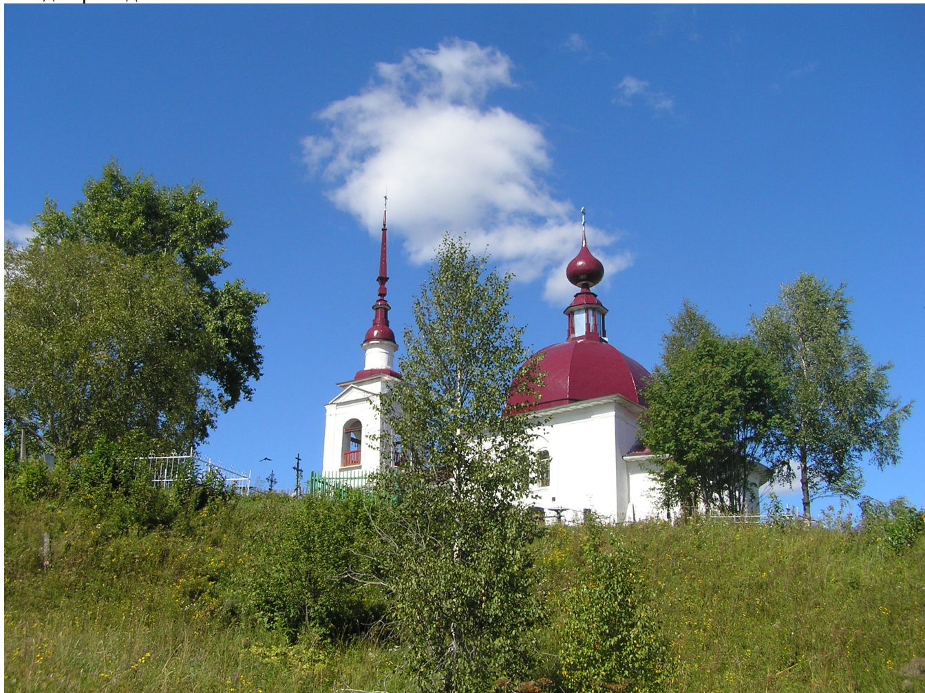
Восстановленный храм Георгия Победоносца в Боросвиди (2016)

И пусть будет наш пройденный и неизведанный путь созидательным, чтобы наша дорога всегда приводила к ХРАМУ.