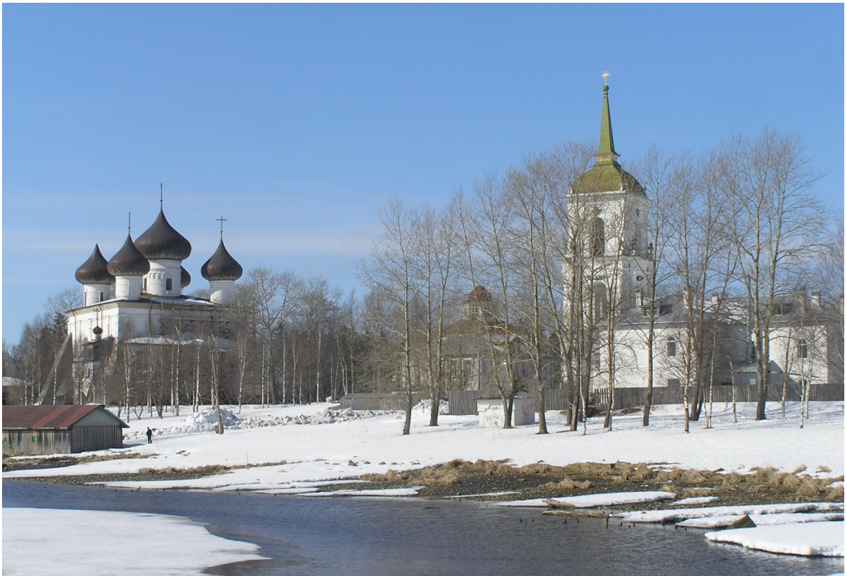
Соборная площадь. Христорождественский собор, Введенская церковь и Колокольня – музейные объекты (1999)