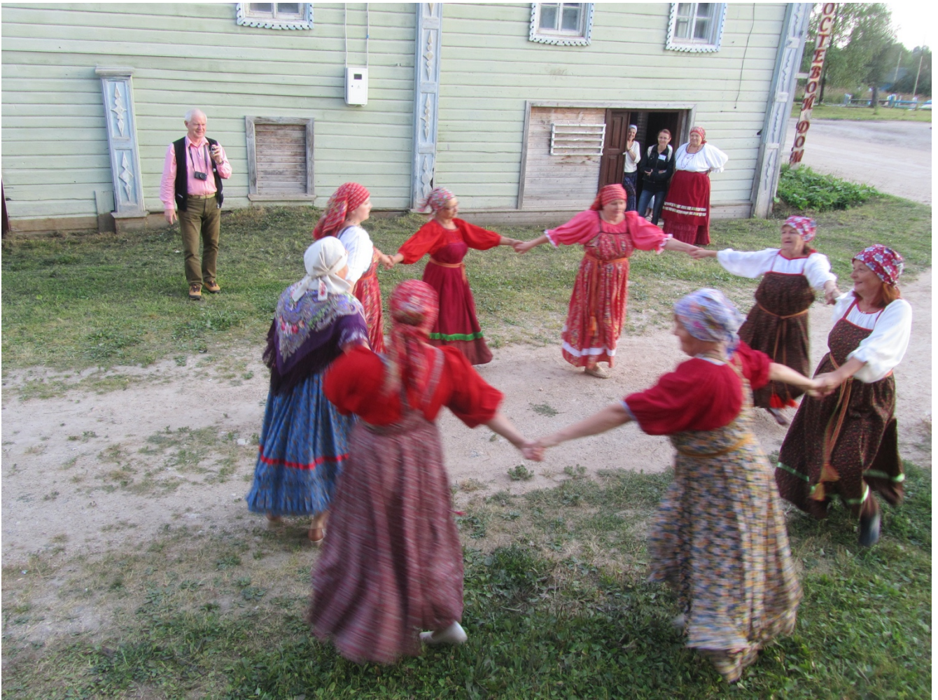
Выступление местного фольклорного ансамбля (2018)