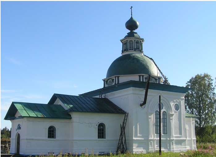
Живоначалъной в Кречетово (2016)

Из Вытегорского уезда тракт подходил к южной оконечности озера Лаче, а затем вдоль его