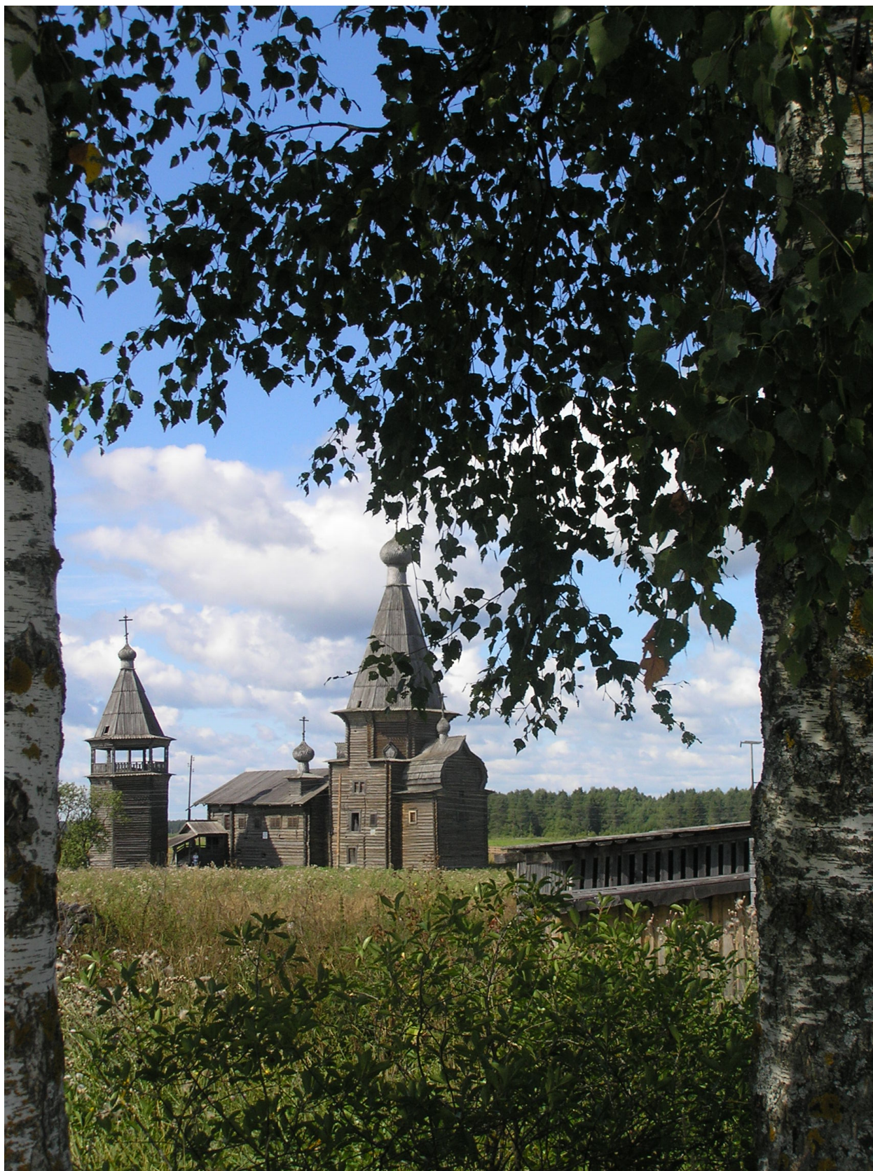
Храмовый ансамбль церкви Иоанна Златоуста в Саунино (2016)

Если выехать из Каргополя по Архангельскому тракту и на первом повороте свернуть налево, мы окажемся в Саунино.