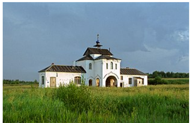
Надвратная церковь Кожеозёрского Богоявленского монастыря

На уединённом острове озера Коже существовала обитель, история которой во многом ещё не раскрыта и хранит много тайн. В отличие от монастырей Александро-Ошевенского, Кирилло-Челмогорского и Макариевского название этой обители связано не с именами святых подвижников, а с географическим положением и посвящением храма. Называется обитель – Кожеозерский (Кожеезерский) Богоявленский мужской монастырь 75 . Находится в 110 километрах к югу от г. Онега Архангельской области (ныне за пределами Каргопольского района).