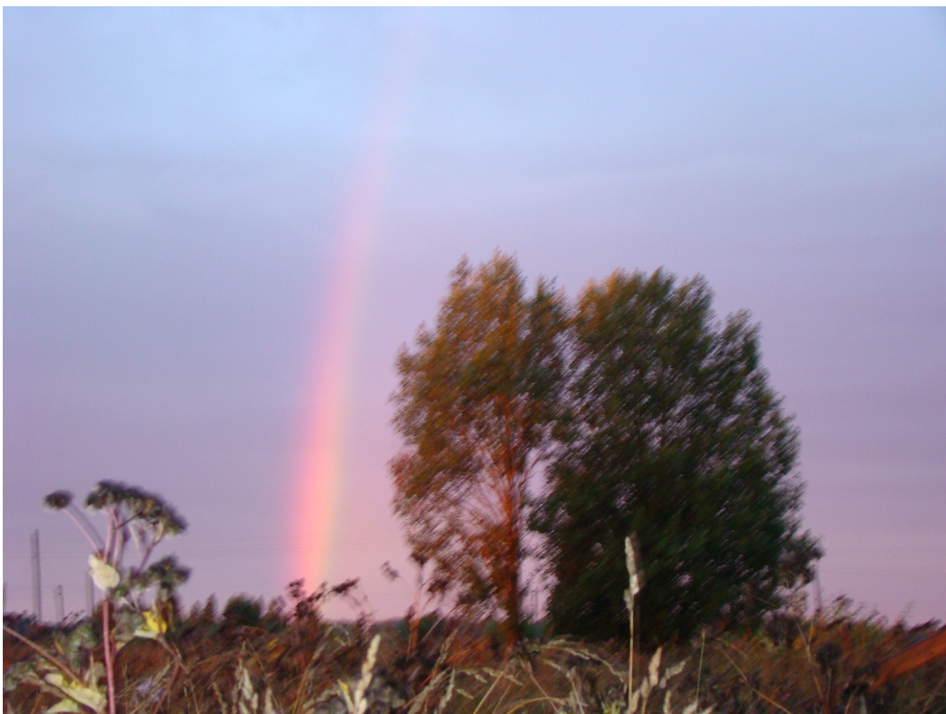
Окружающая среда у Лядинского погоста (2002)

Желающим получить более подробную информацию о монастырях, церквях, приходах и подвижниках Каргополья можно обратиться к творческому наследию К.А. Докучаева-Баскова. «Он описывал жизнь, деятельность, хозяйственный уклад, архитектуру, иконы северных монастырей, издавал документы, грамоты и описи монастырского имущества, приходо-расходные книги, что является важным источником для учёных, даёт достаточно полное представление о хозяйстве, формах и способах его ведения» 8 .