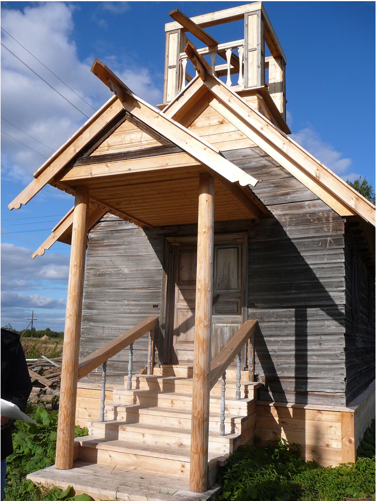
Часовня Флора и Лавра в Калитинке (2014)