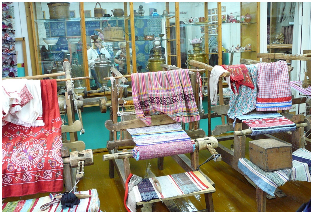
Экспозиция музея в здании начальной школы (2004)