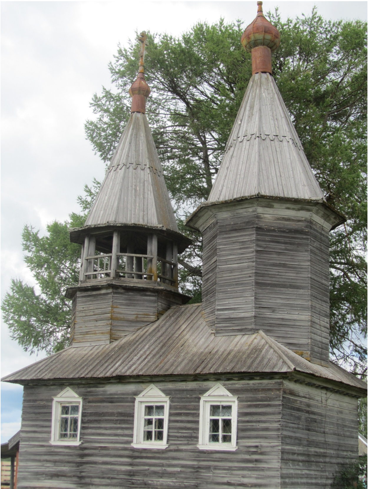
Георгиевская часовня в деревне Низ (2018)

В свое время в деревне Малый Халуи была поставлена часовня во имя Ильи-пророка (Ильинская). Ныне восстановлена. Можно полюбоваться.