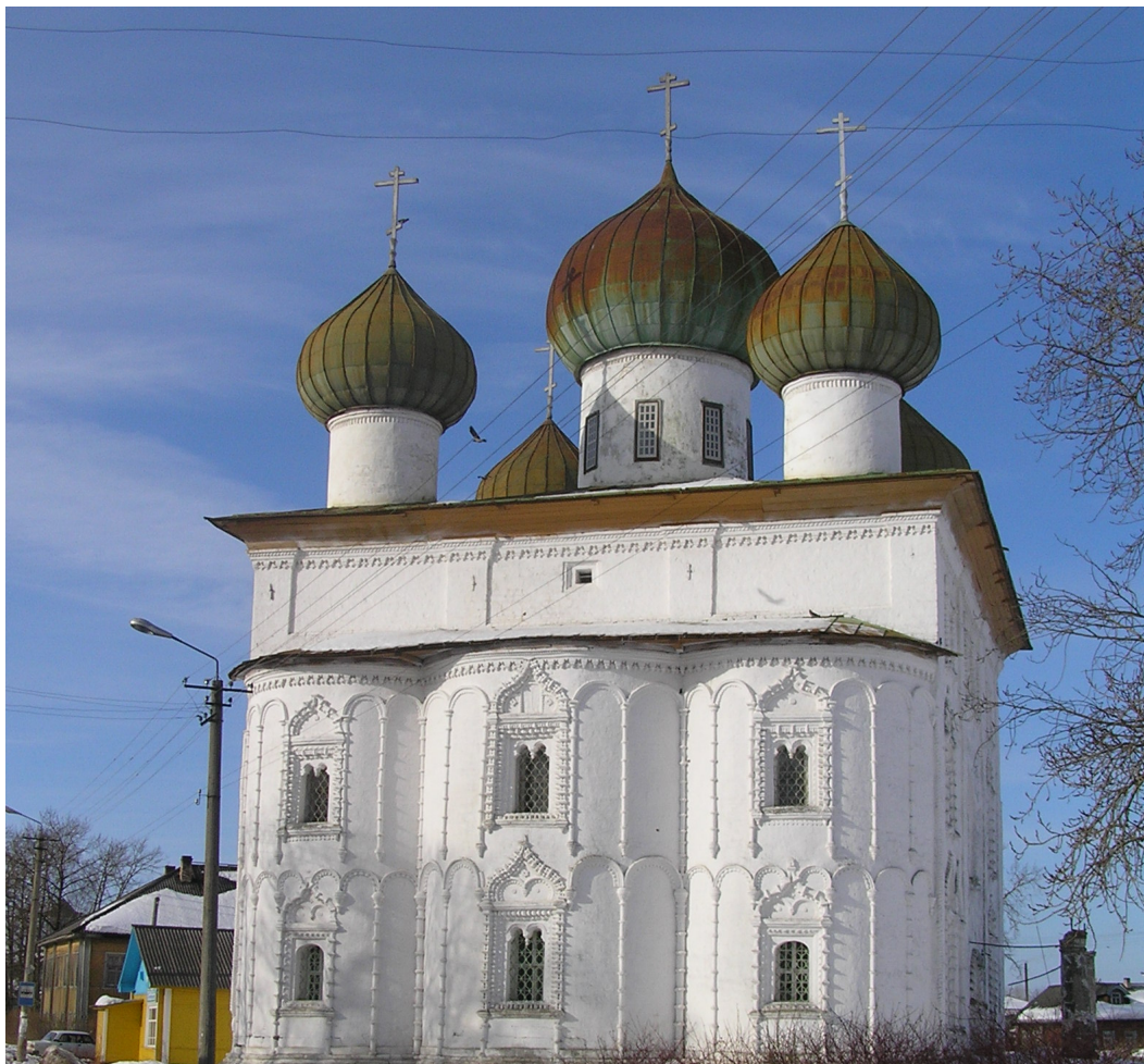
Бгаговещенская церковь с её каменным узорочьем (2000)