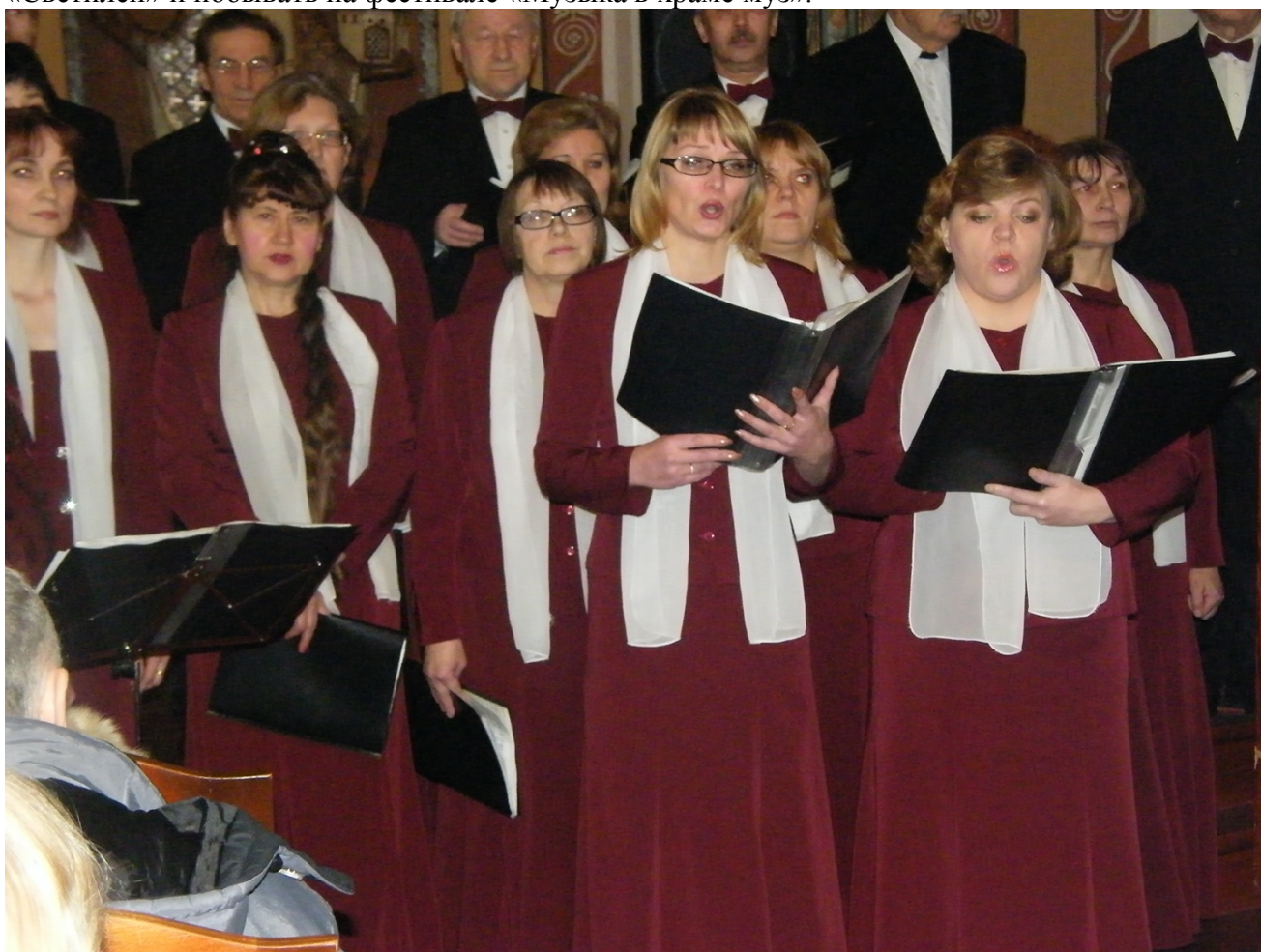
Выступление хора духовной музыки «Светилен» в здании Зосимо-Савватиевского храма (2006)

Вначале следует ознакомиться с памятниками самого города Каргополя. Не жалейте времени. Остановитесь здесь на 3-4 дня или планируйте так, чтобы с новым приездом увидеть новое, ранее не изведенное. Здесь ведь не только храмы-памятники. Здесь два действующих храма. Церковь Рождества Богородицы никогда не закрывалась, что является единственным, в своём роде уникальным явлением. Поэтому её надо посетить, побывать на службе, послушать церковный хор, принять участие в церковных обрядах, возобновившемся крестном ходе. Второй храм – церковь Иоанна Предтечи – сохранился благодаря тому, что был в составе Каргопольского музея. Пришла пора, и храм передан церкви, где регулярно проводятся службы, есть свой приход. В других храмах (музейных зданиях) – постоянные и временные экспозиции с интересной тематикой. В недавнем прошлом это были: «Каргопольская свадьба», «Каргопольская ярмарка», «На перекрестке почтовых трактов», «Магия народного искусства», «Шёл коня ковать», «Город у моря» и др. Новинка последнего времени – «Музейный дворик» под открытым небом. В Христорожественском соборе мастерски выполненный резной иконостас. В церкви Зосимы и Савватия представлено историко-культурное наследие Каргополя. Здесь же, если повезет, можно послушать концерт в прекрасном исполнении хора духовной музыки «Светилен» и побывать на фестивале «Музыка в храме муз».