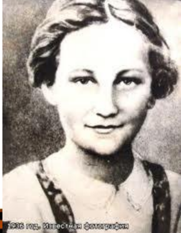
1936 год. Известиям фотографии