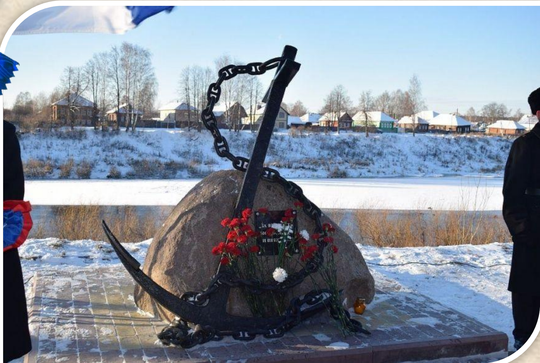
ПАМЯТНИК МОРЯКАМ-БУЕВЛЯНАМ В Г.БУЕ