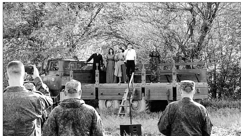
Солисты Оренбургской музкомедии выступили в нескольких километрах от линии фронта.