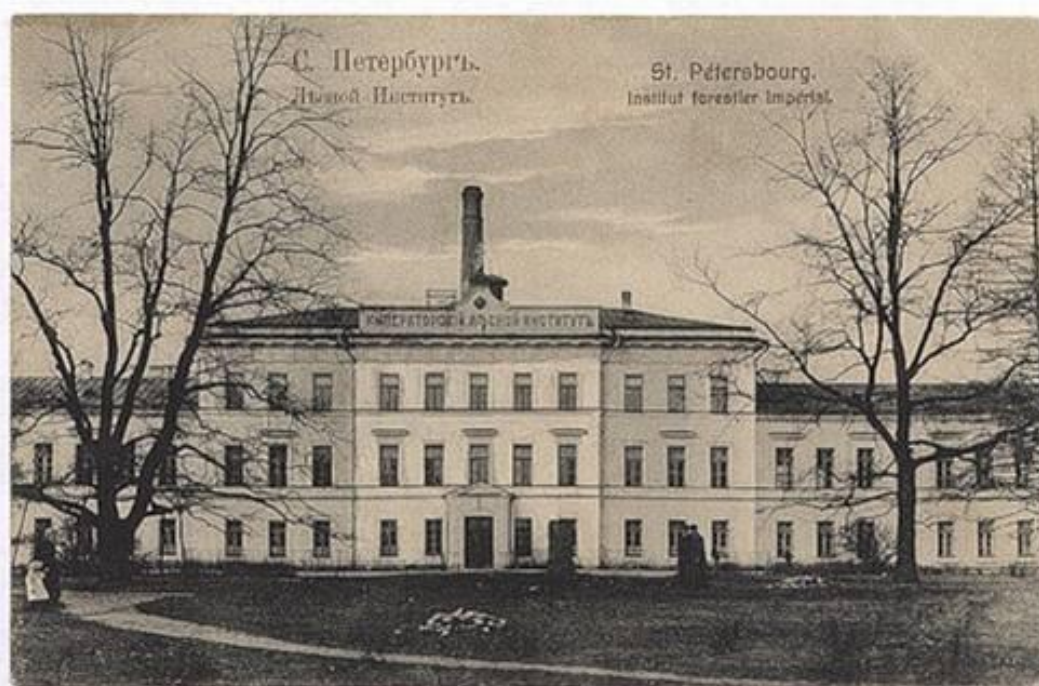
Санкт-Петербургский лесной институт – крупнейший лесной ВУЗ Российской Империи