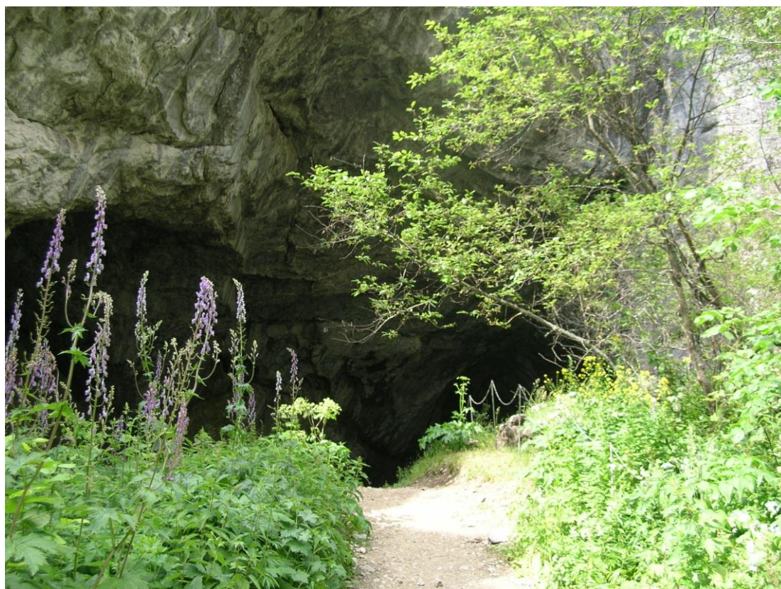
Вход в пещеру Шульган-Таш (Капову).