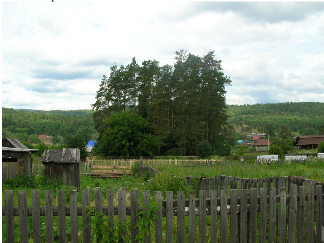
Сосновая роща Симона в д. Иргизлы (Бурзянский район РБ).

В начале 1900-х годов Ф.П. Симоном в д. Иргизлы был заложен лесной питомник (перс. сообщ. М.Н. Косарева); сейчас на его месте в центре деревни шумит сосновая роща.