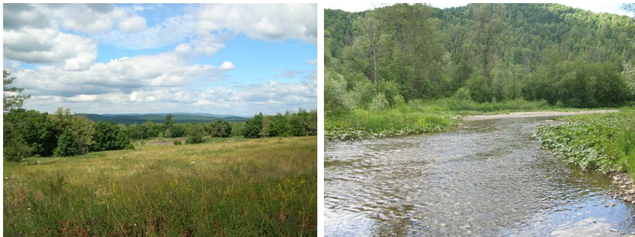
Зилаирское плато и долина р. Малый Ик (Кугарчинский район РБ).

ведомостях [22], затем в развернутом виде – в Лесном журнале [23]. Возможно, в это время им были направлены в печать и другие научно-популярные публикации; в частности, известна его заметка о роли леса в предотвращении засух и «охранении вершин речек» [19, с. 2].