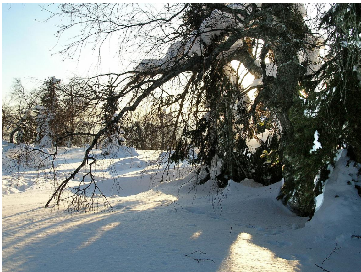
Северная страна – царство света и теней (Южно-Уральский государственный природный заповедник, Белорецкий район РБ).

Важная информация, в определенной степени подтверждающая вышеизложенную схему взаиморасположения заморских стран, содержится и в других надписях ( извл. 3 ). Так, «крылатая птица не гнездится» к западу от Вавилонии, т.е. за Персидским заливом в пустынях Аравийского полуострова (ведь, согласно древним воззрениям, в пустынях жизнь замирает). Страна же на востоке-северо-востоке от Вавилонского царства, где в изобилии водятся опасные «дикие быки» (шестой остров), будет примерно соответствовать Средне- и Центрально-Азиатскому региону (дикой рогатой живности, кстати, там предостаточно). Итак, не только в Индии, Иране и Греции архаического периода, но и в Древнем Вавилоне имелись определенные, хотя и поверхностные, знания о северном крае света, стало быть, к VI в. до н.э. это было уже общим географическим достоянием народов Южной Европы и Передней Азии.